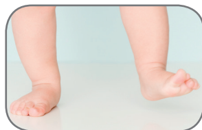
lower limbs (legs)