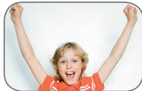
upper limbs (arms)